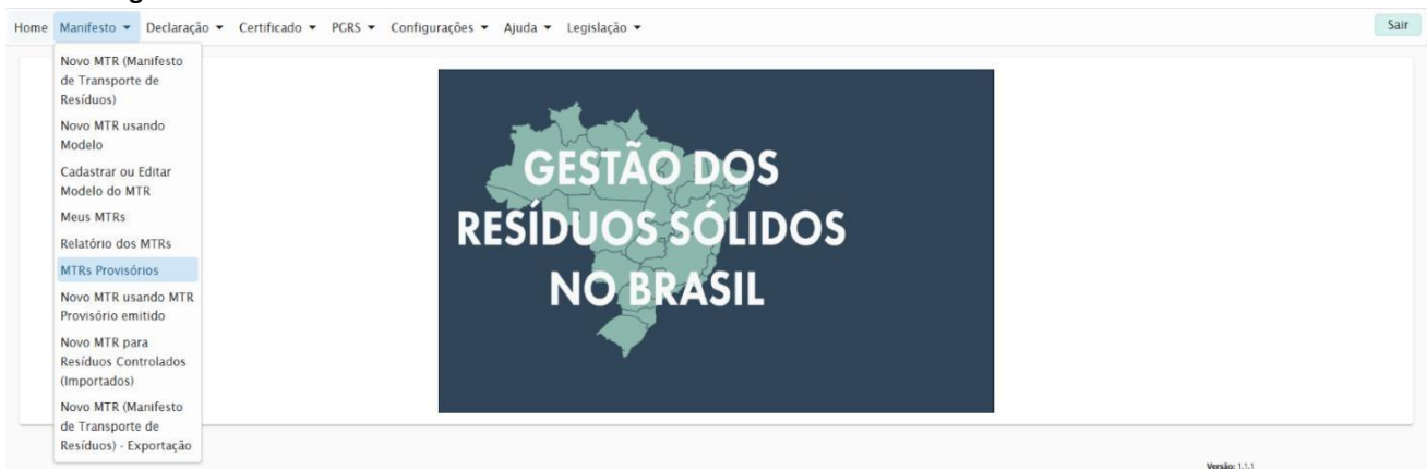
Imagem 01: Tela inicial > Menu Manifesto > MTRs Provisórios